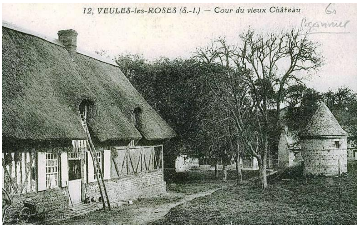
Een torenduivenhok zoals Estienne bedoelde in Veules les Roses

Noch men machse oock niet laten sonder schoon ende claer water, niet meer dan de andere voorseyde voghels. De lijstse met myrtusbesien ghevult ende geroost is een sonderlinghe remedie tegen den rooden camerganc ende te veel waters maken.