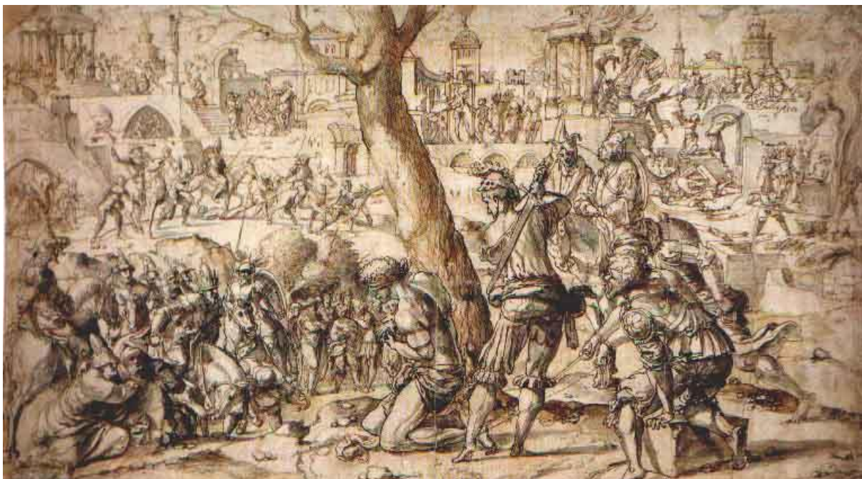
Het martelaarschap van Sint-Joris.