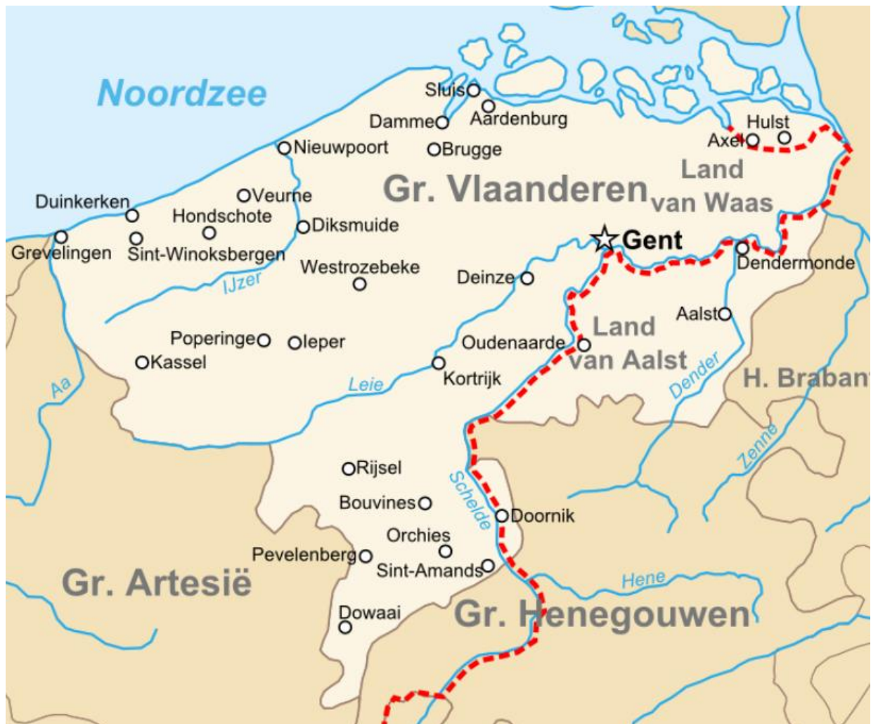
Vlaanderen op het einde van de 14 de eeuw - Wikipedia

En dat gaf dan weer munitie aan de aanhangers van Clemens.