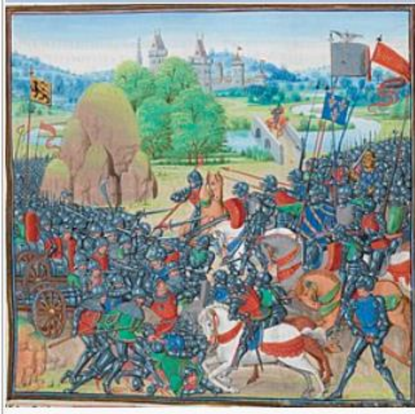
Slag van Roosebeke - Kroniek van Jean Frossaert

Op de 27 ste november 1382 trekt Van Artevelde met zijn Gentenaars naar Westrozebeke waar hij tegenover het leger van de graaf komt te staan. De Vlamingen hebben de eerste aanval van het voetvolk met succes afgeslagen. Overmoedig ging Van Artevelde zelf in de aanval maar werd door de ruitery op de flanken aangevallen. Van Arteveldes leger werd in de pan gehakt. Hij zelf bleef onder de doden.