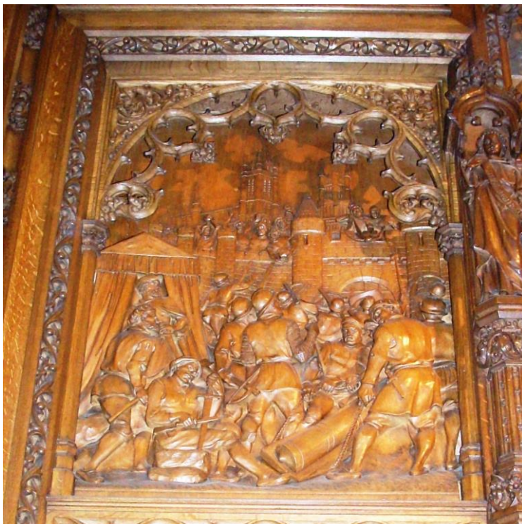
'Het beleg van Ieper', zoals afgebeeld op het retabel van het altaar van O.L. Vrouw der Thuynen in de Sint Maartenskerk te Ieper.