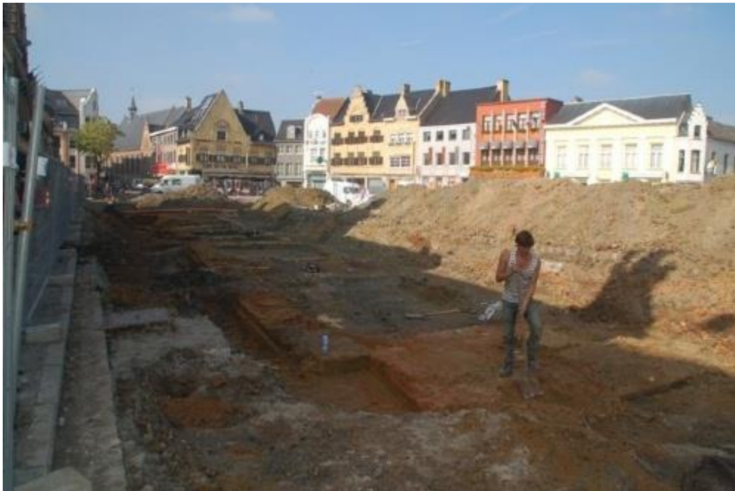
Hierbij zien we de grondvesten van de laken- of doekhalle zoals ze in 2011 werd blootgelegd.