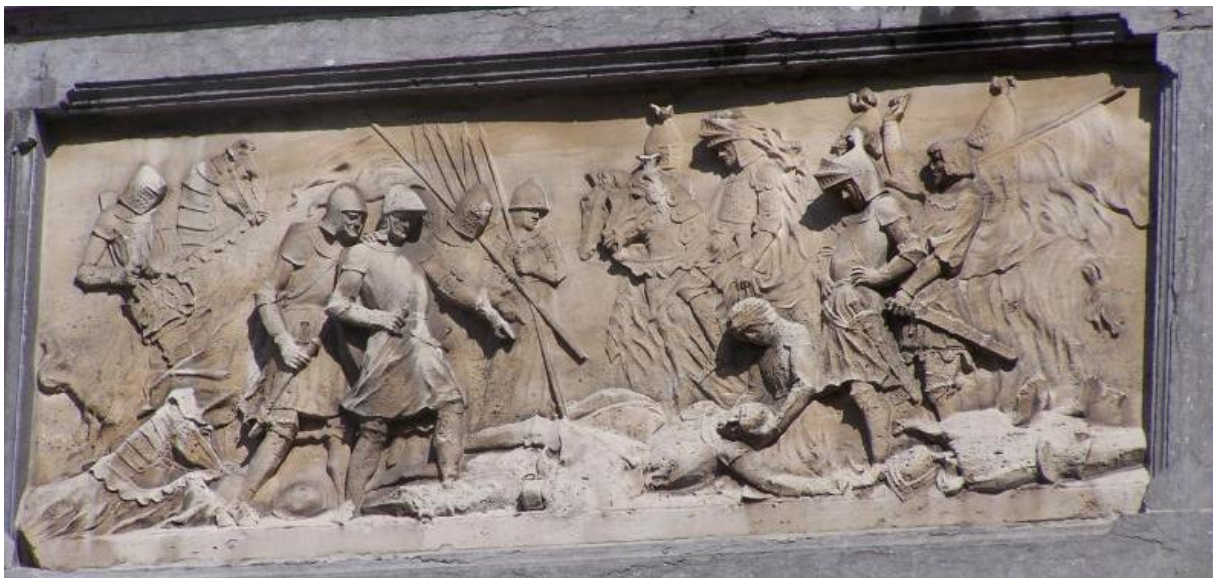
Gevelsteen aan het huis van Van Artevelde

Dese overgebrogte bevelhebbers wierden al op de brugghe van Ipre onthoofd ende op de Iperschen berg wierd den koopdag gehouden van den genomen buyt in denwelken die van Doornyck, van Ryssel, van Douay en van Atrecht grooten ryckdom hebben gehaelt, want sy coopliden afsonden om alle dese goederen voor slegten prijs te coopen, dewelk sy naemaels met onuysprekelyk gewin hebben verkogt.