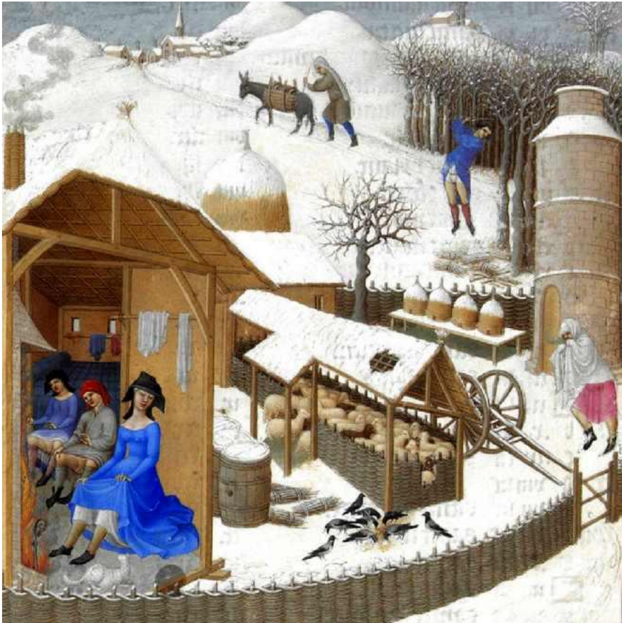
Februari uit de kalender van de Duc de Berry - 1390

der eeuwicheit en wort u andere van my ghedaen!’ ende rijdende met dien weder zijnder veerden van daer hy ghecomen was. Van dezer wonde ende quetsure wiert die prince terstont zo buytermaten qualick bestaen tot hy hem met grooter weerdicheit tot alle zijne kerckelicke gherechten vouchde, verghevende die van Ghendt uytter gront van sijnder herte al tghuene da zy oyt jehens hem mesdaen ofte verbuert mochten hebben, ende biddende den hertoghe Philips van Bourgoengen , ghezeit de stout, zijnen schoonzune, die vrou Margriete van Male, zijn eeneghe dochter by vrou margriete, zijnder huysvrau, ... ghetraut hadde, dat hy hemlieden naer zijn aflijvicheit gracelick ende ghenadelick tracteren wilde, twelcke hy by goede beseghelthede beloofde te doene. Ende ten derden daghe naer tvoorscreven verraderlicke ende moordadich faict verschiet die grave Lodewijck van dezer weerelt.