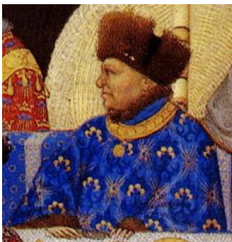
Jan van Berry

In de ‘Cronycke van den lande ende graefschape van Vlaenderen’ schrijft men in 1383 nog het volgende: Ten anderen dache van lauwe – januari – overleet die abt Jan van St. Bertin te St. –Omaers, poortere va nder stede van Ipere, die welcke zo ondieerlicke ende onvermueghen vet was, dat hy qualick gheghaen ende niet gheslapen en conste dan al zittende.