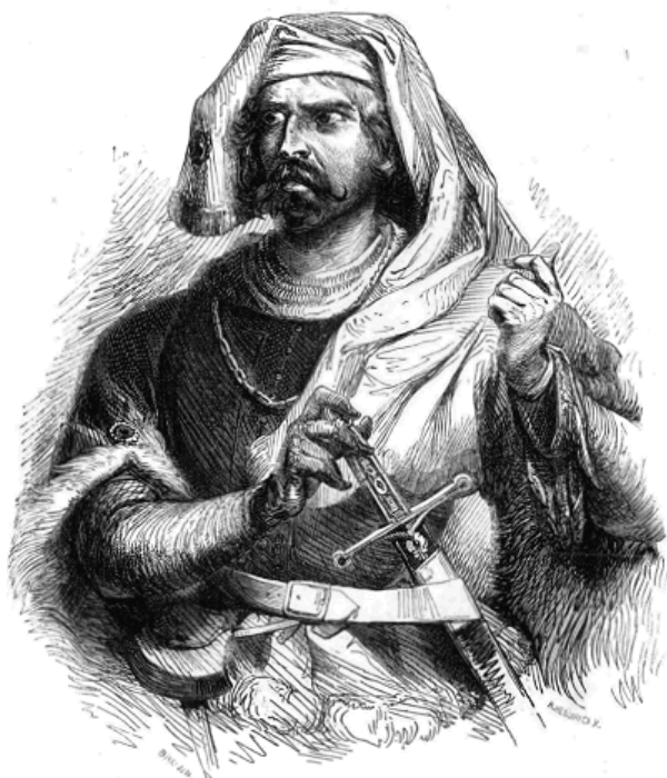
Philips Van Artevelde.