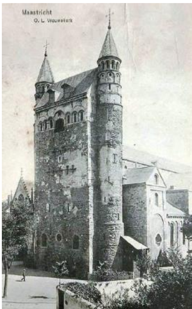
De romaanse gevel van de O.L. Vrouwekerk te Maastricht

molen in erfpacht gegeven werd aan het gild der brouwers aldaar. Wij deelen hier in regest dien brief mede.